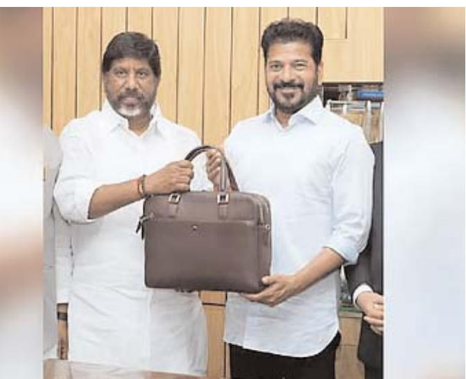
ముఖ్యమంత్రి, ఆర్థిక మంత్రి మల్లు భట్టి విక్రమార్కు 2026-27 ఆర్థిక సంవత్సరానికి గాను రూ. 3,24,234 కోట్ల భారీ బడ్జెట్ను అసెంబ్లీలో ప్రవేశపెట్టారు. గత ప్రభుత్వాల ఆర్థిక విధ్వంసాన్ని సరిదిద్దుతూ, ఆర్థిక క్రమశిక్షణతో రాష్ట్రాన్ని ప్రగతి పథంలో నడిపించడమే లక్ష్యమని ఆయన స్పష్టం చేశారు.

రాష్ట్రాన్ని ప్రగతి పథంలో నడిపించడమే లక్ష్యం ప్రజల సేవకుల లాగా పని చేస్తున్నాం గతంలో జరిగిన ఆర్థిక తప్పిదాలను సరిదిద్దుతూ అట్టడుగు వర్గాల సంక్షేమానికి ఈ బడ్జెట్ ఉప ముఖ్యమంత్రి, ఆర్థిక మంత్రి మల్లు భట్టి విక్రమార్కు హైదరాబాద్, స్యూన్వార్ ప్రతినధి తెలంగాణ రాష్ట్ర ఆర్థిక ముఖవిత్రాన్ని ఆవిష్కరిస్తూ ఉప