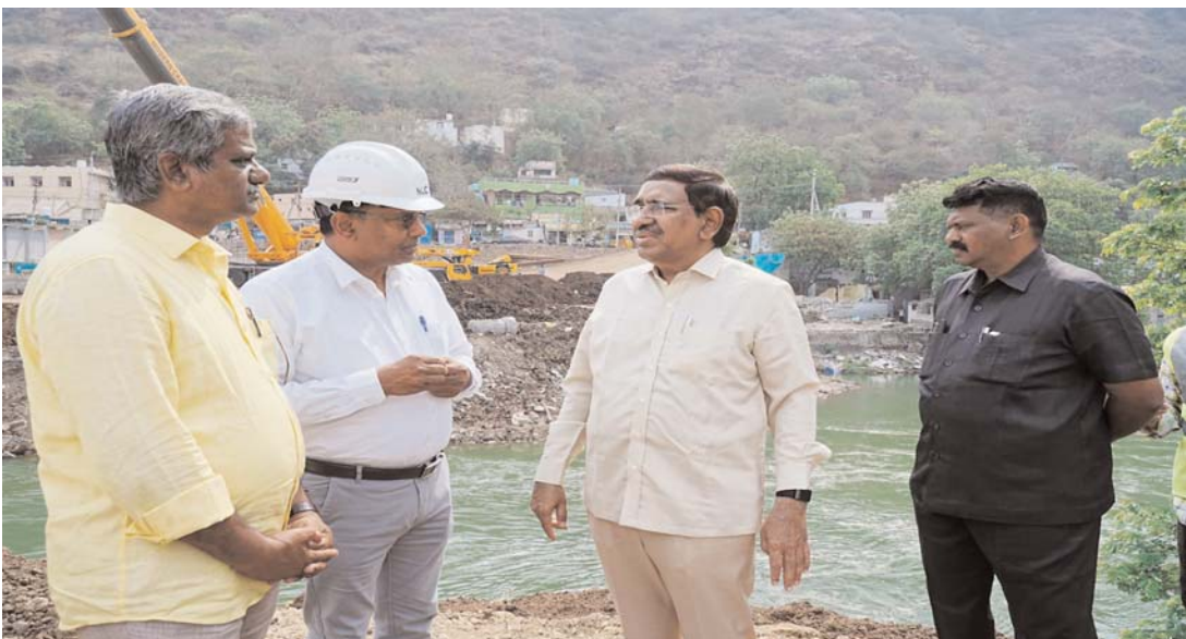
పారదర్శకంగా పనులు జరుగుతున్నాయని పేర్కొన్నారు. ప్రభుత్వం నుంచి రూ. 15 వేల కోట్లు, హాబీ ద్వారా మరో రూ. 11 వేల కోట్లు సమకూర్చుకుంటున్నట్లు మంత్రి నారాయణ వెల్లడించారు.

అమరావతి ఆంధ్రప్రదేశ్ రాజధాని అమరావతి నిర్మాణ పనులపై రాష్ట్ర మున్సిపల్, పరిపాలన శాఖ మంత్రి పొంగూరు నారాయణ కీలక అవ్ డేట్స్ ఇచ్చారు. అసెంబ్లీ, హైకోర్టు, సెక్రటేరియట్ టవర్లను ప్రపంచ స్థాయి ప్రమాణాలతో ఐకానిక్ కట్టడాలుగా నిర్మిస్తున్నామని స్పష్టం చేశారు. ఏపీ రాజధాని అమరావతి నిర్మాణంలో భాగంగా నిర్మిస్తున్న ఐకానిక్ భవనాల విశిష్టతను, నిధుల సమీకరణను మంత్రి నారాయణ వివరించారు. అమరావతి అసెంబ్లీ భవనాన్ని 250 మీటర్ల ఎత్తులో నిర్మిస్తున్నామని తెలిపారు. ఈ భవనంపైకి ప్రజలు వెళ్లి మొత్తం అమరావతి నగరాన్ని వీక్షించేలా ప్రత్యేక ఏర్పాట్లు చేస్తున్నామని తెలిపారు. ప్రపంచంలోని ఉత్తమ అసెంబ్లీ భవనాల్లో ఒకటిగా ఇది నిలుస్తుందని మంత్రి ధీమా వ్యక్తం చేశారు. అసెంబ్లీ, హైకోర్టుతో పాటు మరో ఐదు ఐకానిక్ టవర్లను అత్యధుత్వంగా నిర్మిస్తున్నామని మంత్రి నారాయణ వెల్లడించారు. ఐకానిక్ భవనాలు కాబట్టి సాధారణ భవనాల కంటే వీటికి ఖర్చు కొంత ఎక్కువగా ఉంటుందని తెలిపారు. ఇతర రాష్ట్రాల్లోని ఐకానిక్ భవనాల రేట్లతో పోల్చి వీటిని చూస్తున్నామని, ఎస్ఆర్ (హాబీ) రేట్ల ప్రకారం నిబంధనలను ఖచ్చితంగా పాటిస్తూ