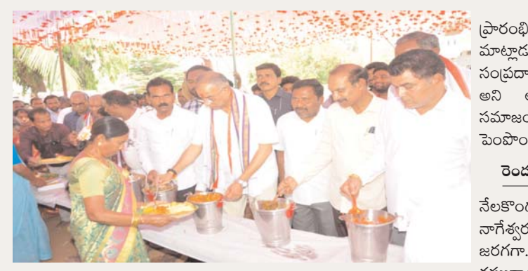
ప్రారంభించారు. ఈ సందర్భంగా ఎంపీ మాట్లాడుతూ.. భారతీయ సంస్కృతి, సంప్రదాయాల పరిరక్షణ ప్రతి ఒక్కరి బాధ్యత అని అన్నారు. ఇటువంటి పండుగలు సమాజంలో బక్తత, భక్తి భావాలను పెంపొందిస్తాయని పేర్కొన్నారు.