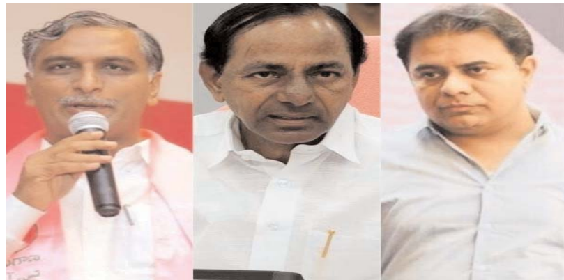
హైదరాబాద్, న్యూస్ వార్ ప్రతినిధి

మాజీ సీఎం, బీఆర్ఎస్ అధినేత కేసీఆర్ తో మాజీ మంత్రులు కేటీఆర్, హరీష్ రావు భేటీ అయ్యారు. ఈరోజు (బుధవారం) ఉదయం ఎర్రవల్లి ఫాంహౌస్ కు చేరుకున్న మాజీ మంత్రులు.. కేసీఆర్ తో కీలక సమావేశం నిర్వహించారు. బీఆర్ఎస్ పార్టీ ఆవిర్భావ దినోత్సవం సందర్భంగా షీనర్ నిర్వహించడంపై ప్రధానంగా చర్చించారు. ఏప్రిల్ 27న షీనర్ లేదా జనరల్ బాడీ మీటింగ్ నిర్వహించే యోచనలో గులాబీ అధిష్టానం ఉన్నట్లు తెలుస్తోంది. ఉమ్మడి రంగారెడ్డి జిల్లాలో షీనర్ లేదా జనరల్ బాడీ పెట్టాలని బీఆర్ఎస్ భావిస్తున్నట్లు సమాచారం. కేసీఆర్ తో భేటీ అనంతరం దీనిపై స్పష్టత వచ్చే అవకాశం ఉంది. కాంగ్రెస్ సీనియర్ నేత, జగిత్యాల మాజీ ఎమ్మెల్యే జీవన్ రెడ్డి.. బీఆర్ఎస్ పార్టీలో చేరికపై కూడా నేటితో క్లారిటీ వచ్చే అవకాశం ఉంది. కేసీఆర్ తో భేటీ అనంతరం జీవన్ రెడ్డిని మాజీ మంత్రి కేటీఆర్ కలవనున్నారు. జీవన్ రెడ్డిని బీఆర్ఎస్ పార్టీలోకి కేటీఆర్ స్వయంగా ఆహ్వానించనున్నట్లు సమాచారం. అపై కేసీఆర్ తో జీవన్ రెడ్డి సమావేశం అయ్యే అవకాశం ఉన్నట్లు తెలుస్తోంది. గత వారం రోజులుగా మాజీ మంత్రి కేటీఆర్ అమెరికా పర్యటనలో ఉన్నారు. ఈరోజు ఉదయమే అయిన హైదరాబాద్ కు చేరుకున్నారు. ఈ నేపథ్యంలో రాష్ట్రంలో తాజా రాజకీయ పరిణామాలపై కేసీఆర్ తో కేటీఆర్, హరీష్ భేటీ అయి చర్చించారు.