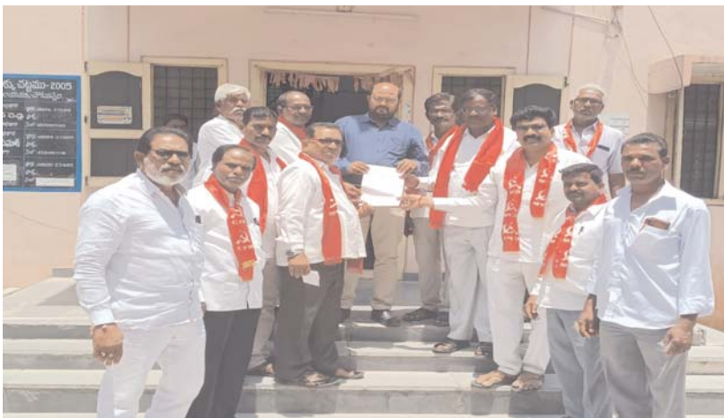
న్యూస్ వార్ నారాయణపురం :

మండలశీ లోని కంకణాలగూడెం రెవిన్యూ పరిధిలోగల 164 సర్వే నెంబర్ లో గతంలో డబల్ డెడ్ రూమ్ ఇళ్ళు నిర్మాణం చేపట్టారు కానీ ఇట్టి నిర్మాణాలను ప్రభుత్వం నేటికీ పూర్తి చేయకుండా ఉండటంతో ఈ నిర్మాణాలన్నీ ఆసంపూర్తిగా ఉన్నాయి కాబట్టి వాటి స్థానంలో లబ్ధిదారులకు ఇందిరమ్మ ఇండ్లు కట్టుకోవడానికి ప్రభుత్వం వెంటనే అనుమతి ఇవ్వాలని సిపిఐ ఆధ్వర్యంలో తాసిల్దార్ కు విసతి పత్రం సమర్పించారు.