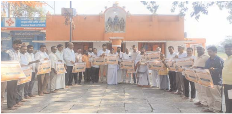
స్టూన్ వార్ మర్రిగూడ ప్రతినిధి :