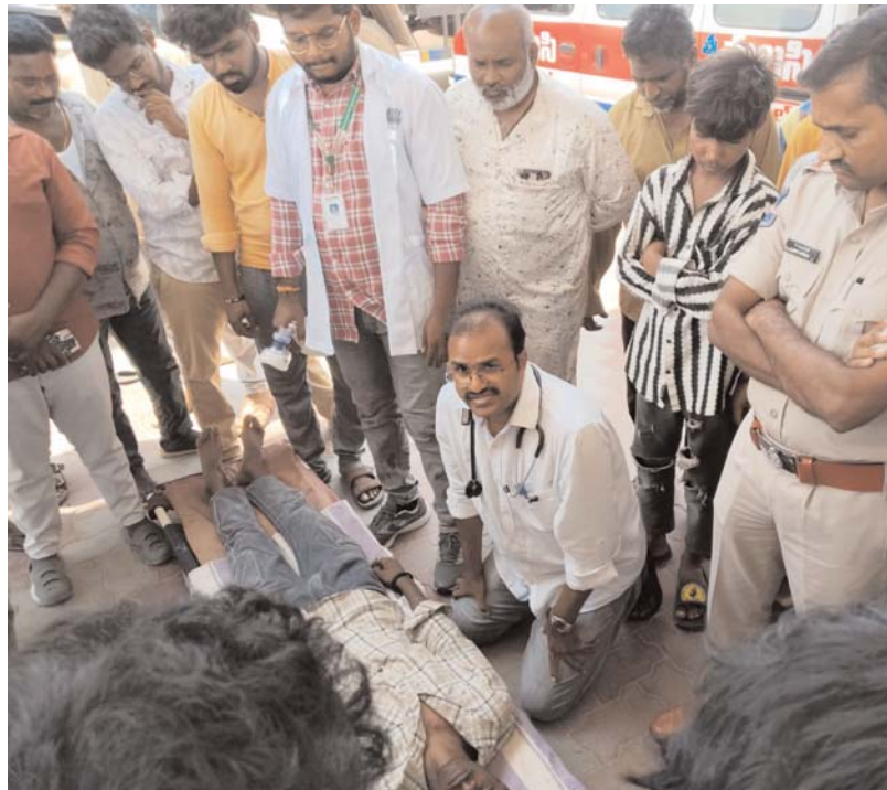
న్యూస్ వార్ చందూర్ :