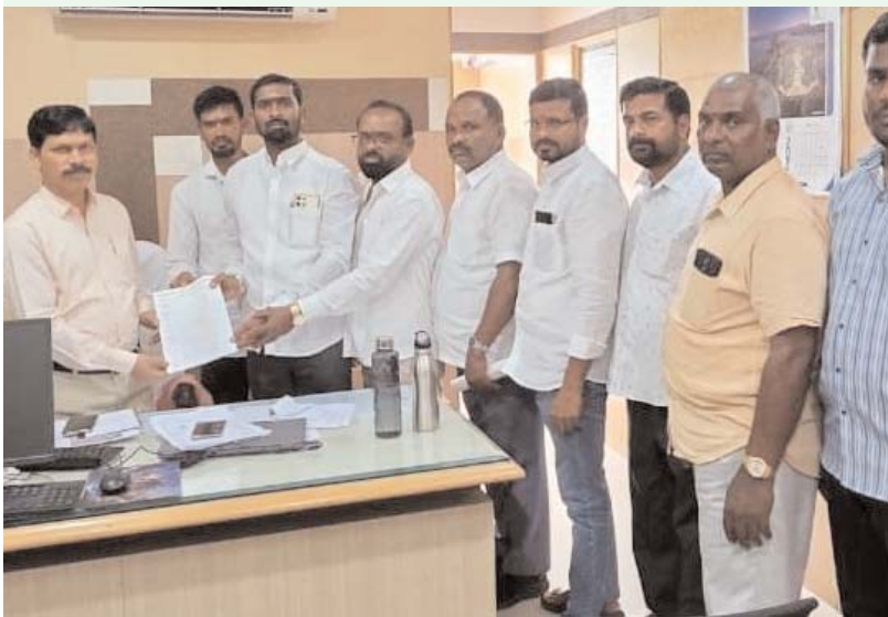
న్యూస్ వార్ హుయిల్ సగర్ :