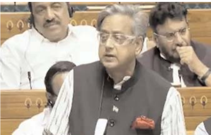
శశిధరూర్ తెలిపారు. కేంద్ర ప్రభుత్వం మహిళా రిజర్వేషన్ బిల్లు తీసుకురావడం మంచిదేనని, అయితే దీని అమలుకు

పార్లమెంట్లో లోక్ సభ, శాసనసభ నియోజకవర్గాల పునర్విభజన (డీలిమిటేషన్) అంశంపై చర్చ తీవ్రపాటు దాల్చింది. జనాభా అధారంగా సీట్ల సంఖ్యను పెంచాలనే ఉద్దేశ్యంతో, కేంద్ర ప్రభుత్వం డీలిమిటేషన్ ప్రక్రియకు సంబంధించి చొరవ తీసుకుంటోంది. అయితే డీలిమిటేషన్ బిల్లును ప్రతిపక్ష పార్టీలు వ్యతిరేకిస్తున్నాయి. ఇవాళ (శుక్రవారం) రెండో రోజు కూడా డీలిమిటేషన్ బిల్లుపై చర్చ జరుగుతోంది. డీలిమిటేషన్తో దక్షిణాది రాష్ట్రాలకు నష్టం జరుగుతుందని కాంగ్రెస్ ఎంపీ శశిధరూర్ అన్నారు. లోక్ సభలో ఆయన మాట్లాడుతూ.. దక్షిణాది రాష్ట్రాల నష్టం జరగడం ప్రధాని మోడీ, కేంద్ర చోరీ మంత్రి అమిత్ షా మాట్లాడుతున్నారని, వారి మాటలకు విరుద్ధంగా డీలిమిటేషన్ బిల్లు రూపొందించారని ఆయన విమర్శించారు. డీలిమిటేషన్తో దక్షిణాది రాష్ట్రాలు రాజకీయంగా మరింత నష్టపోతాయని