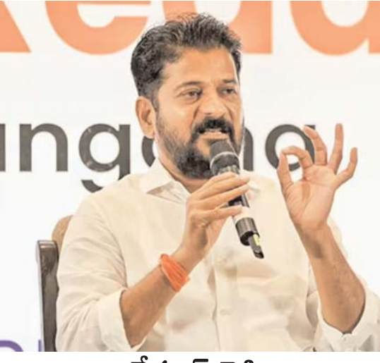
రేవంత్ రెడ్డి ఢిల్లీ, న్యూస్వార్ ప్రతినది

చంద్రబాబునాయుడు పరిస్థితి కూడా అలాగే నితీశ్ కుమార్, ఏక్ నాథ్ సిండేల పరిస్థితి చూస్తున్నాం లోక్ సభ, రాజ్యసభ ఉన్నది చట్టాలు చేయడానికి మాత్రమే వాటిని అమల్లోకి తీసుకువచ్చేది రాష్ట్ర ప్రభుత్వాలు తెలంగాణ ముఖ్యమంత్రి