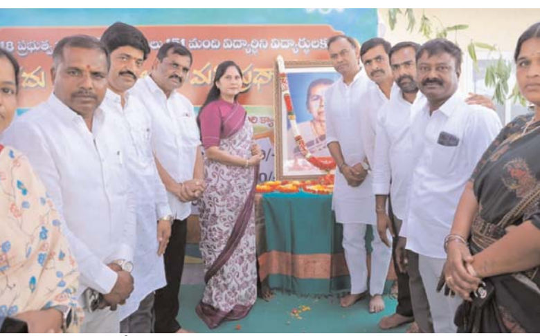
ముసుగోడు స్టూన్ వార్ ప్రతినిధి: