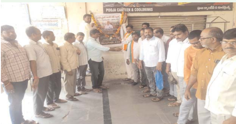
చౌటుప్పల్ స్టూన్ వార్ ప్రతినిధి: