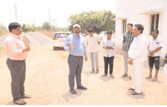
అందిన దరఖాస్తులను రికార్డులతో సరిచూసి క్షేత్రస్థాయిలో పరిశీలించి త్వరగా పరిష్కరించాలని అధికారులకు

అర్జులైన లబ్ధిదారులకు రెండు పడక గదుల ఇండ్లు అందించడం జరుగుతుందని జిల్లా కలెక్టర్ కుమార్ దీపక్ తెలిపారు. మంగళవారం జిల్లాలోని బెల్లంపల్లి మండల కేంద్రంలో గల రెండు పడక గదుల ఇండ్లను అధికారులతో కలిసి పరిశీలించారు. ఈ సందర్భంగా జిల్లా కలెక్టర్ కుమార్ దీపక్ మాట్లాడుతూ, నిరుపేదలకు గౌరవ కనిపించే ఉద్దేశంతో చేపట్టిన రెండు పడక గదుల పథకంలో అర్జులైన లబ్ధిదారులకు అందించడం కొరకు చర్యలు తీసుకోవడం జరుగుతుందని తెలిపారు. అనంతరం మన కేంద్రంలోని సబ్ కలెక్టర్ కార్యాలయాన్ని సందర్శించి సబ్ కలెక్టర్ మనోజ్ తో కలిసి కార్యాలయ రికార్డులు, దరఖాస్తుల ప్రక్రియను పరిశీలించారు. వివిధ భూ సమస్యలపై భూభారతి రెవెన్యూ సదస్సులో