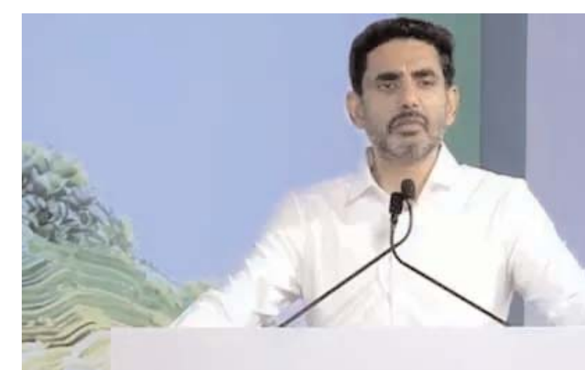
అమరావతి, న్యూస్ వార్ ప్రతినిధి

విశాఖ పట్టణం ముఖ చిత్రం ఒక్కరోజు నుంచే మారబోతుందని ఎపి మంత్రి లోకేశ్ తెలిపారు. కొత్త చరిత్రకు పునాది వేసిన పవిత్రమైన రోజు అని ఆనాడు అనుకున్న నిర్ణయం ఈనాడు కార్యరూపం దాల్చిందని అన్నారు. విశాఖ: తర్జుమాలో గూగుల్ ఎపి డేటా సెంటర్ కు భూమిపూజ చేశారు. కేంద్రమంత్రి అశ్వినీ వైష్ణవ్, ఎపి సీఎం చంద్రబాబు నాయుడు, లోకేశ్ భూమిపూజ చేశారు. ఈ సందర్భంగా లోకేశ్ మీడియాతో మాట్లాడుతూ.. ఎపి అభివృద్ధిలో పాలుపంచుకోంటున్న ప్రతీ ఒక్కరికీ, ప్రాజెక్టుకు భూములిచ్చిన రైతులందరికీ చూడదయ్యే కృతజ్ఞతలు తెలియజేశారు. మొదట ప్రస్తావన జరిగిందని, ఇప్పటివరకు ఒక లెక్క.. ఇప్పటి నుంచి మరో లెక్క అని ఇప్పటి నుంచి విశాఖ.. డేటా ఎపి హాట్ గా పిలుచుకోబోతున్నామని ఇక నుంచి గోబల్ ఐటీ మ్యూవ్ లో విశాఖ అనే పవిత్ర పట్టణం ఉండబోతుందని లోకేశ్ పేర్కొన్నారు. వైజాగ్ లో జి అంటే గూగుల్ అనే శబ్దం మార్కెట్ గబోతోందని ఐటీల్లో విద్యుంస పాలన చూశామని అన్నారు. పరిశ్రమలు ఎపికి రావడానికి మూడు ప్రధాన కారణాలు ఉన్నాయని, ఆ మూడు కారణాలు.. డబల్ ఇంజన్ ఐటీల రైలు సర్కార్ అన్నారు. చంద్రబాబు నాయకత్వం, స్పీడ్ ఆఫ్ డూయింగ్ బిజినెస్ తో మరిన్ని పెట్టుబడులు రాబోతున్నాయని, డబల్ ఇంజన్ సర్కార్ తో ప్రయోజనాలు చూపిస్తున్నామని చెప్పారు. సమాచార కొత్త అర్థం చెబుతున్నానని, సమా అంటే నాయుడు, మోడీ అని అన్నారు. పెట్టుబడులతో ఆంధ్రప్రదేశ్ చరిత్ర సృష్టిస్తోందని లోకేశ్ కొనియాడారు.