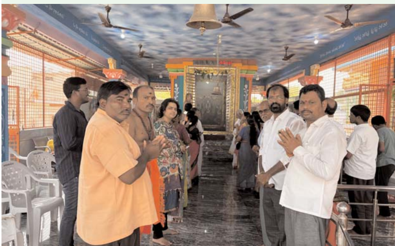
స్వామి వార్ నాంపల్లి ప్రతినిధి :