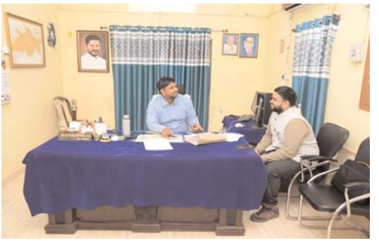
సూచించారు. ఈ కార్యక్రమంలో సంబంధిత అధికారులు తదితరులు పాల్గొన్నారు.