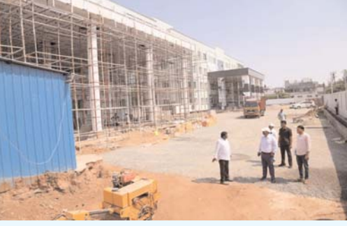
తెలిపారు. గురువారం జిల్లాలోని మంచిర్యాల పట్టణంలో గల సాయికుంట్ల ప్రాంతంలో చేపట్టిన ప్రభుత్వ నర్సింగ్