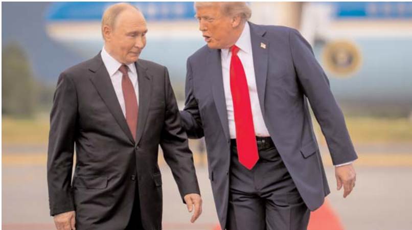
హైదరాబాద్ న్యూస్వార్ ప్రతినధి

పశ్చిమాసియాలో ఉద్రిక్తతలు, ఉక్రెయిన్ యుద్ధం మొదలైన అంశాలపై రష్యా అధ్యక్షుడు వ్లాదిమిర్ పుతిన్తో అమెరికా ప్రెసిడెంట్ డొనాల్డ్ ట్రంప్ మాట్లాడారు. ఈ ఇరువురూ దాదాపు 90 నిమిషాలు పాటు ఫోన్లో మాట్లాడుకున్నారు. ఇద్దరి మధ్య జరిగిన సంభాషణ గురించి రష్యా అధ్యక్ష భవనం క్రెమ్లిన్ సహాయకుడు యూరీ ఉషాకోవ్ వెల్లడించారు. ఇరాన్పై మళ్లీ సైనిక చర్యలకు దిగితే అత్యంత ప్రమాదకర పరిస్థితులను ఎదుర్కోవాల్సి ఉంటుందని డొనాల్డ్ ట్రంప్ను పుతిన్ హెచ్చరించారని ఉషాకోవ్ పేర్కొన్నారు. అలాగే ఇరాన్తో కాల్పుల విరమణ ఒప్పందం పొడిగించు నిర్ణయాన్ని పుతిన్ స్వాగతించారన్నారు. ఇరాన్తో ఉద్రిక్తతలను ముగించేందుకు అవసరమయ్యే దౌత్య ప్రయత్నాలకు రష్యా సిద్ధంగా ఉందని ట్రంప్ను పుతిన్ చెప్పారని తెలిపారు. అలాగే ఉక్రెయిన్ యుద్ధం గురించి కూడా ఇరు దేశాల నేతలు మాట్లాడుకున్నట్లు పేర్కొన్నారు. కాగా, ఇరాన్ వద్ద ఉన్న శుద్ధి చేసిన యురేనియం నిల్వల గురించి పుతిన్ తనతో మాట్లాడినట్లు ట్రంప్ వెల్లడించారు. ఇరాన్ వద్ద ఉన్న అణు నిల్వల విషయంలో సహాయం చేసేందుకు తాము సిద్ధంగా ఉన్నామని, అవసరమైతే వాటిని రష్యాకు తరలిస్తామని తనతో పుతిన్ చెప్పారని ట్రంప్ తెలిపారు. అయితే, 'మీరు నాకు సహాయం చేసే ముందు, ఉక్రెయిన్ యుద్ధాన్ని ముగించడంపై రృప్తి పెట్టండి' అని తాను బదులిచ్చినట్లు ట్రంప్ పేర్కొన్నారు. అలాగే ఉక్రెయిన్తో కొద్ది రోజుల పాటు కాల్పుల విరమణను పుతిన్ సూచించారని, దీనిపై త్వరలోనే అధికారిక ప్రకటన వెలువడవచ్చని ట్రంప్ పేర్కొన్నారు.