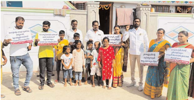
సంస్థాన్ నారాయణపురం మే 2 (నవ్యా వార్) :

బడిబాట కార్యక్రమంలో గ్రామ సర్పంచి ప్రకటన