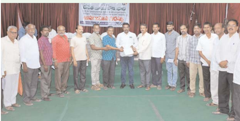
చౌటుప్పల్ మే 2 (నవ్యా వార్)