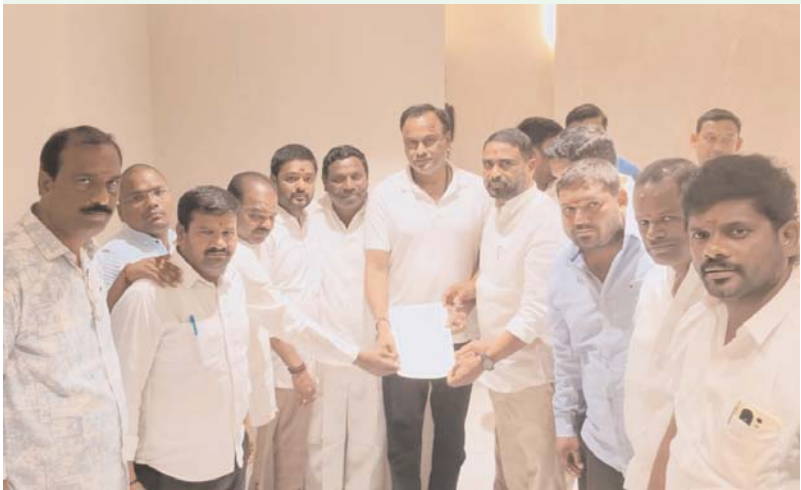
చౌటుప్పల్ మే 6 (స్వామి వార్)