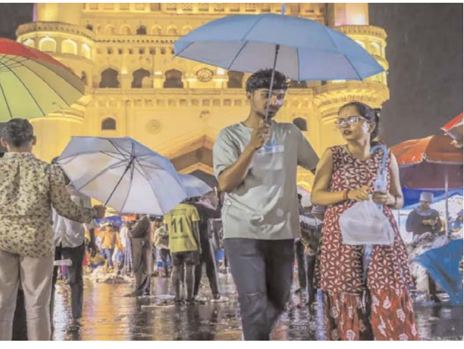
సంభవించే సమయంలో చెట్ల

తెలుగు రాష్ట్రాల ప్రజలకు వాతావరణశాఖ కీలక హెచ్చరిక జారీ చేసింది. ఆంధ్రప్రదేశ్, తెలంగాణలో రాబోయే మూడు రోజుల పాటు పలుచోట్ల వర్షాలు కురిసే అవకాశముందని తెలిపింది. తెలంగాణ, రాయలసీమ, తమిళనాడు మీదుగా కొమోడిన్ ప్రాంతం వరకు ఉపరితల ద్రోణి కొనసాగుతోందని అధికారులు వెల్లడించారు. ఈ పరిస్థితుల ప్రభావంతో ఆంధ్రప్రదేశ్ లోని పోలవరం, విశాఖపట్నం, అనకాపల్లి, కాకినాడ, తూర్పుగోదావరి, అంబేద్కర్ కోనసీమ, అల్లూరి సీతారామరాజు, పార్వతీపురం మన్యం జిల్లాల్లో పిడుగులతో