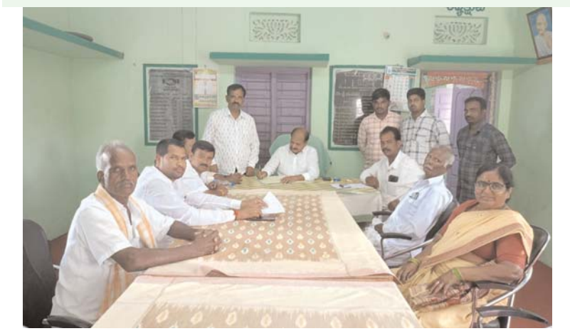
చౌటుప్పల్ మే 6