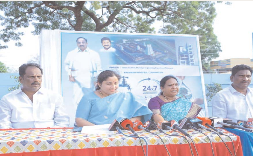
డీఎఫ్ఐటీ ప్రాజెక్ట్... ఇంటికే మినరల్ నీరు

దేశంలోనే తొలిసారిగా డీఎఫ్ఐటీ (డీఐఓ ప్రోజెక్ట్ టూప్) ప్రాజెక్ట్ ఖమ్మంలో ప్రారంభం కానుందని మేయర్ రావూరి కరుణ సైదుబాబు వెల్లడించారు. ఈ పథకం ద్వారా ట్యాప్ తీవ్రగానే నేరుగా మినరల్ నీరు అందనుందని తెలిపారు. మొదటగా 15వ డివిజన్ పరిధిలో ఈ ప్రాజెక్ట్ అమలు చేయనున్నట్లు చెప్పారు. అమ్మత్ పథకం, మునిసిపల్ నిధులతో వాటర్ ట్యాంక్ నిర్మాణం చేపడుతున్నట్లు పేర్కొన్నారు. వేలాది కుటుంబాలకు శుద్ధి చేసిన తాగునీరు అందనుందని వివరించారు. ప్రజల ఆరోగ్య పరిరక్షణలో ఇది కీలక అడుగు అన్నారు. ఆధునిక సాంకేతికతతో నీటి శుద్ధి వ్యవస్థ ఏర్పాటు చేస్తున్నారని తెలిపారు. దేశానికి ఆదర్శంగా నిలిచే ప్రాజెక్ట్ గా ఇది మారనుందని చెప్పారు. ఈ ప్రణాళిక కూడా మంత్రి తుమ్మల దూరదృష్టి ఫలితమేనని స్పష్టం చేశారు.