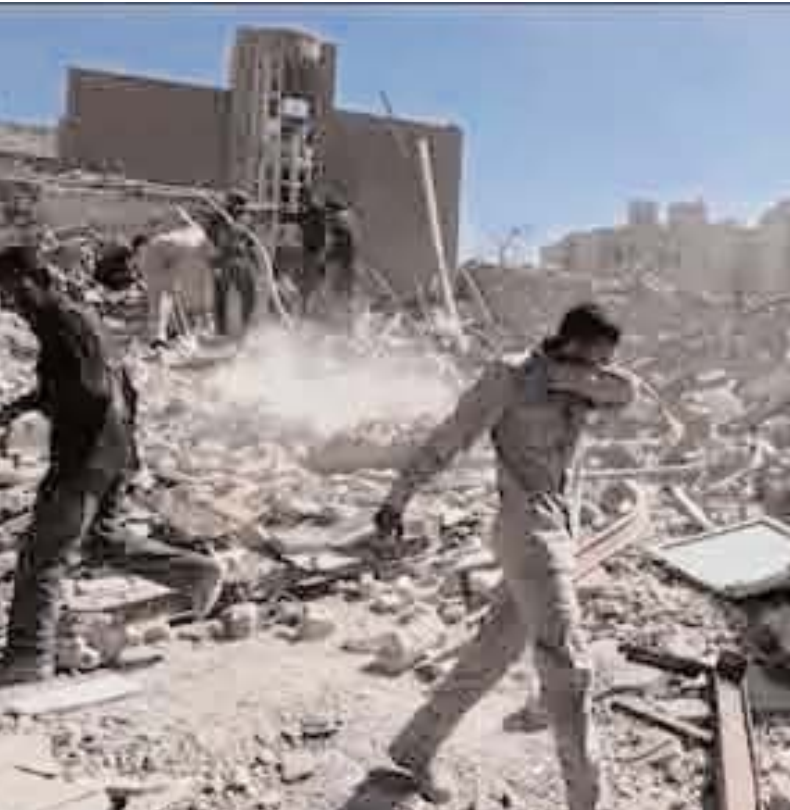
ఉభయతరంగా ఉండేలా నిబంధనలను రూపొందించుకోవడం ఉత్తమం. ఇరాన్ కోరుతున్నట్లుగా ఒప్పందం అంటూ కుదిరితే, ఆ దేశం పై తాత్కాలికంగా కాకుండా, శాశ్వతంగా దాడులు చేయకుండా ఉండాలి. అమెరికా- ఇరాన్ తీసుకునే నిర్ణయాల ప్రభావం ప్రత్యక్షంగా పశ్చిమాసియా భవిష్యత్తుపైనూ, పరోక్షంగా ప్రపంచదేశాలపైనూ ఉంటుందనే విషయాన్ని గమనించి ముందడుగు వేయాలి.