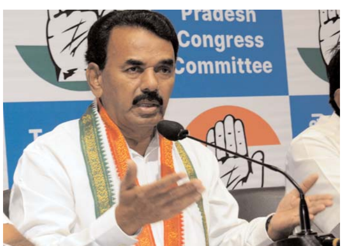
సీఎం రేపంత్ పాలమూరు ప్రాజెక్టుకు శంకుస్థాపన చేశారని... రెండేళ్లలో పూర్తి చేస్తామన్నారుని గుర్తు చేశారు. లక్ష కోట్ల ప్రాజెక్టును పడేళ్ల రూ. 25 వేల కోట్ల మాత్రమే ఖర్చు పెడితే 90 శాతం ఎలా పూర్తి అయినట్లు అని ప్రశ్నించారు.

బీఆర్ఎస్ నేతలకు పాలమూరు ప్రాజెక్టుల గురించి మాట్లాడే అర్హత లేదని మంత్రి జూపల్లి కృష్ణారావు అన్నారు. పాలమూరు ప్రాజెక్టులపై గత ప్రభుత్వం పూర్తి నిర్లక్ష్యం వహించిందని విమర్శించారు. గట్టు కల్పకుర్తి, జూరాల, కోయిల్ సాగర్, భీమా అన్నీ ప్రాజెక్టుల విషయంలో పక్షపాతం చూపారని మంత్రి మండిపడ్డారు. కల్పకుర్తి పంపులు కూడా బాగు చేయలేకపోయారన్నారు. పాలమూరు ప్రాజెక్టు నీటి కేటాయింపులు సాధించలేకపోయారని తెలిపారు. కృష్ణా నీటిని పడేళ్లు ఏపీకి తాకట్టు పెట్టారని ఆరోపించారు. రాయలసీమను రక్షణలో సీమ చేస్తామని చెప్పింది బీఆర్ఎస్ కాదా అని ప్రశ్నించారు. గద్యాల్లోని రిస్కర్లను రిజర్వాయర్ను పడేళ్లలో రిస్కర్ల చేయలేదన్నారు. పాలమూరు ప్రాజెక్టుల విషయంలో సీఎం రేపంత్ రెడ్డితో స్వయంగా ఎమ్మెల్యేలు, మంత్రులు కలిసి చర్చించామని చెప్పారు. సీఎం కూడా పాలమూరు వాసి కాబట్టి.. ప్రాజెక్టుల విషయంలో ప్రత్యేక శ్రద్ధ పెట్టామని, పనులను పూర్తి చేస్తామని స్పష్టం చేశారు. కల్పకుర్తి కింద చేపట్టనున్న గొల్లపల్లి రిజర్వాయర్ను చేపట్టవద్దని బీఆర్ఎస్ నేతలు ఆందోళనలు చేస్తున్నారని మంత్రి జూపల్లి కృష్ణారావు మండిపడ్డారు.