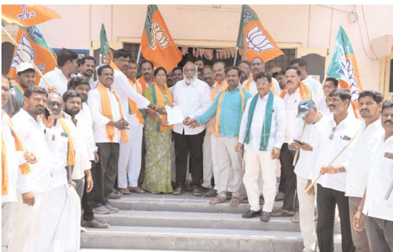
చౌటుప్పల మే 21 (స్వామి వారి)

భారతీయ జనతా పార్టీ చౌటుప్పల్ పట్టణ మరియు మండల శాఖ తరపున రైతులు పండించిన వరి ధాన్యాన్ని వెంటనే కొనుగోలు చేయాలని డిమాండ్ చేస్తూ ఆర్టివోకు వినతిపత్రం సమర్పించిన సందర్భంలో వరి కోతలు పూర్తయి నెలరోజులు కావస్తున్నా ఇంతవరకు కేవలం 30 శాతం ధాన్యాన్ని మాత్రమే కొనుగోలు చేశారని ఖరీఫ్ సీజన్ మొదలు కావస్తున్నప్పటికీ వరి ధాన్యాన్ని కొనుగోలు చేయలేకపోతున్నారని రాష్ట్ర ప్రభుత్వాన్ని విమర్శించారు ధాన్యం తూకాన్ని 41 కిలోల 100 గ్రాములకు వేయాల్సి ఉండగా 42 కిలోలతో తూకం వేస్తూ అధికారులు మిల్లర్లు కలిసి రైతులను దోపిడి చేస్తున్నారని ఉన్నతాధికారులు కొరవ తీసుకొని రైతులను దోపిడి చేస్తున్న వారిపై చర్యలు తీసుకోవాలని, అలాగే అకాల వర్షం వల్ల పాడైపోయిన వరి ధాన్యాన్ని కొనే బాధ్యత కూడా రాష్ట్ర ప్రభుత్వమే వహించాలని వారు డిమాండ్ చేశారు.