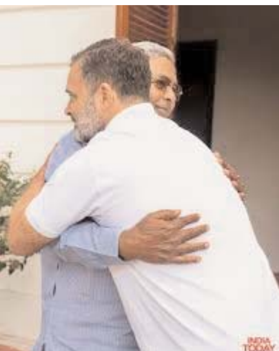
అధిష్ఠానంతో వరుస సమావేశాలు జరుపుతున్నారు. ఈ సమావేశంలో సిద్ధరామయ్య తన డిమాండ్లను అధిష్ఠానం ముందుంచినట్లు చెబుతున్నారు. యతీంద్ర సిద్ధరామయ్యకు ఉపముఖ్యమంత్రి పదవిని సిద్ధరామయ్య ఆశిస్తున్నారు. దీనితో పాటు కాంగ్రెస్ సీనియర్ నేతలు కేజే జార్జి, జి.పరమేశ్వరలకు క్యాబినెట్లో చేటు కల్పించాలని సిద్ధరామయ్య కోరినట్లు

కర్ణాటక ముఖ్యమంత్రి సిద్ధరామయ్య రాజీనామాతో డీకే శివకుమార్ ముఖ్యమంత్రి పదవులు చేపట్టనుండటం భాయమైంది. నాయకత్వ మార్పు నేపథ్యంలో తన కుమారుడు, ఎమ్మెల్యే యతీంద్ర సిద్ధరామయ్యకు ఉపముఖ్య మంత్రి పదవి ఇవ్వాలని పార్టీ అధిష్ఠానాన్ని సిద్ధరామయ్య కోరినట్లు విశ్వసనీయ వర్గాల సమాచారం. కీలకమైన సీఎల్పీ నేత ఎన్నిక శనివారంనాడు జరుగుతుంది. సీఎల్పీ నేతగా డీకే ఎన్నికైన అనంతరం ప్రభుత్వం ఏర్పాటుకు మార్గం సుగమమైంది. జూన్ 1న డీకే సర్కార్ ప్రమాణస్వీకారం చేయనుంది. అంతవరకూ ఆపద్ధర్మ ముఖ్యమంత్రిగా సిద్ధరామయ్య కొనసాగుతారు. కాగా, మంత్రివర్గ కూర్పుపై ఢిల్లీలో సిద్ధరామయ్య, డీకే పార్టీ