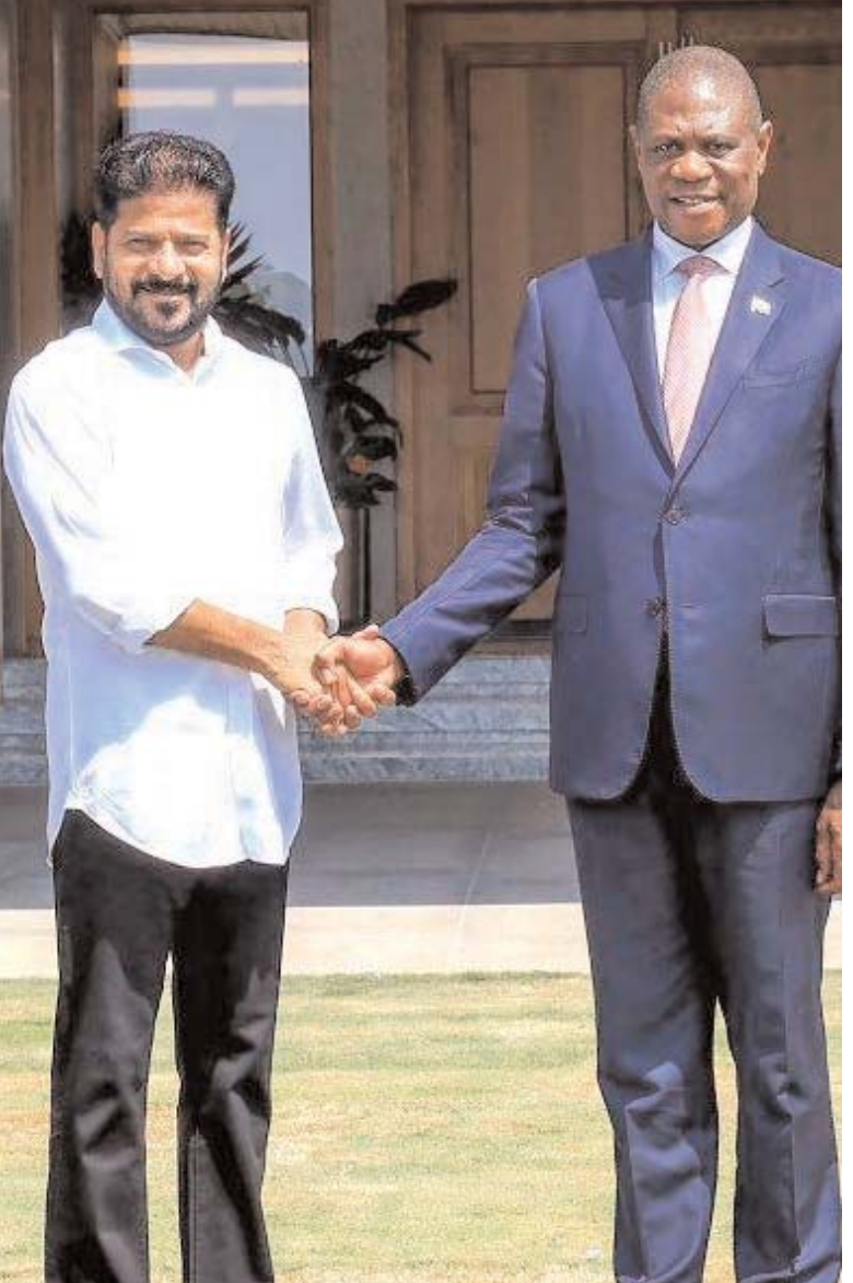
తెలంగాణను పెట్టుబడులకు అత్యంత అనుకూల గమ్యస్థానంగా అభివృద్ధి చేస్తున్నామని ముఖ్యమంత్రి రేవంత్ రెడ్డి వ్యాఖ్యానించారు. విదేశీ పెట్టుబడులను ఆకర్షించేందుకు తమ ప్రభుత్వం ప్రత్యేక చర్యలు తీసుకుంటోందని పేర్కొన్నారు. ఈ రోజు (బుధవారం) సీఎం రేవంత్ రెడ్డిని.. దక్షిణాఫ్రికా ఉపాధ్యక్ష కృషు పాలన్ ముషుటైల్ బృందం ఎం సి హెచ్ ఆర్ డిలో కలిశారు. అధికారిక

తెలంగాణను పెట్టుబడుల గమ్యస్థానంగా తీర్చిదిద్దుతాం ● విదేశీ పెట్టుబడులను ఆకర్షించేందుకు ప్రత్యేక చర్యలు ● పెట్టుబడిదారులకు అనుకూలమైన విధానాలు ● ఇరు ప్రాంతాల ఆర్థికాభివృద్ధికి కొత్త అవకాశాలు ● తెలంగాణ పారిశ్రామిక అభివృద్ధి, సాంకేతిక రంగ పురోగతిపై ఆసక్తి ● భవిష్యత్తులో వాణిజ్య, పెట్టుబడి రంగాల్లో మరింత సహకారం ● ముఖ్యమంత్రి రేవంత్ రెడ్డి 2 లో..