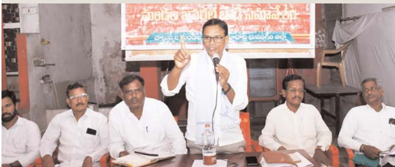
చౌటుప్పల్ మే 8 (సూన్ వార్ )