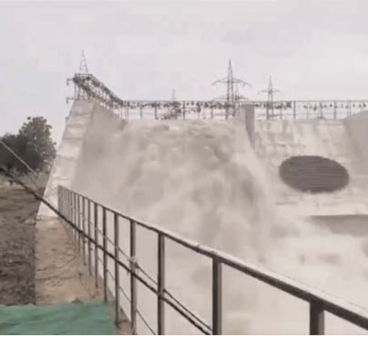
ఉమ్మడి ఖమ్మం జిల్లా నీటిపారుదల ప్రాజెక్టుల పూర్తి కోసం ప్రత్యేక కార్యచరణ రూపొందించనున్నట్లు తెలిపారు. శీతమ్మసాగర్ సహా అన్ని ప్రాజెక్టులను వేగవంతంగా పూర్తి చేస్తామని వెల్లడించారు. ఖమ్మం జిల్లాలో ప్రతి ఎకరాకు సాగునీరు అందించడమే ప్రభుత్వ లక్ష్యమని వెల్లడించారు. భూసేకరణ, అటవీ అనుమతులు, నిర్మల సమస్యలను యుద్ధ ప్రాతిపదికన పరిష్కరిస్తామని చెప్పారు. సీతారామ ప్రాజెక్టు ఖమ్మం భవిష్యత్తును మార్చే ప్రాజెక్టు అని మంత్రి తెలిపారు. పాతేరు లింక్ కెనాల్ ద్వారా కొత్త ఆయకట్టుకు స్థిరీకరణ చేస్తామన్నారు. మున్నేరు - పాతేరు అనుసంధానం.. ఖమ్మం, సూర్యాపేట రైతులకు వరమన్నారు. విద్యుత్ ఖర్చు లేకుండా గ్రామీణీతో నీటిని మళ్లించడమే ప్రభుత్వ లక్ష్యమని పేర్కొన్నారు. భద్రాచలం, ఖమ్మం వరద రక్షణ పనులకు ప్రభుత్వం అత్యంత ప్రాధాన్యం ఇస్తోందన్నారు. రైతు సంక్షేమమే కాంగ్రెస్ ప్రభుత్వ ధ్యేయమని.. ప్రతి ప్రాజెక్టుకు గడువులు నిర్దేశించి నిరంతరం పర్యవేక్షణ చేస్తున్నామని మంత్రి ఉత్తమ్ కుమార్ రెడ్డి పేర్కొన్నారు. ఈ సమావేశానికి ఉపముఖ్యమంత్రి భద్రవీరకమార్లు, మంత్రులు తుమ్మల నాగేశ్వరరావు, పొంగులేటి శ్రీనివాసరెడ్డి, వాకిలీ శ్రీహరి, ఉమ్మడి ఖమ్మం జిల్లాకు చెందిన ప్రజాప్రతినిధులు హాజరయ్యారు.

: ఖమ్మం రైతాంగానికి శాశ్వత సాగునీటి భద్రతే కాంగ్రెస్ ప్రభుత్వ లక్ష్యమని మంత్రి ఉత్తమ్ కుమార్ రెడ్డి స్పష్టం చేశారు. ఈరోజు (గురువారం) జలసౌధలో ఉమ్మడి ఖమ్మం జిల్లా నీటిపారుదల ప్రాజెక్టులపై మంత్రి సమీక్ష నిర్వహించారు.