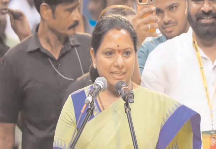
మరికొన్ని రాజకీయ పార్టీలు కూడా అభ్యంతరం వ్యక్తం చేస్తున్నాయి. తెలంగాణ రాజ్య సమితి' పేరుతో సమాధైన మరో రాజకీయ పార్టీ కూడా 'సూ' పేరును ఉపయోగించడాన్ని వ్యతిరేకిస్తూ ఎన్నికల సంఘాన్ని ఆశ్రయించింది. ఈ వివాదంపై వివరణ ఇచ్చేందుకు కవిత ప్రతినిధుల బృందం కూడా ఎన్నికల సంఘాన్ని కలిసొందుకు సిద్ధమవుతున్నట్లు సమాచారం. భారీ సంఖ్యలో అభ్యంతరాలు వ్యక్తమవుతుండటంతో కవిత కొత్త రాజకీయ పార్టీకి 'బీఆర్ఎస్' పేరు దక్కుతుందా లేదా అన్నది ఇప్పుడు రాజకీయ వర్గాల్లో హాట్ టాపిక్ గా మారింది.

ఇప్పటికే తీవ్ర అంతర్గత విభేదాలతో ఇబ్బందులు ఎదుర్కొంటున్న తృణమూల్ కాంగ్రెస్ (పవీజ)లో కీలక పరిణామాలు చోటుచేసుకుంటున్నాయి. టీఎంసీ సీనియర్ నేత, ఎంపీ కల్యాణ్ బెనర్జీ పార్టీ అధినేత మమతా బెనర్జీకి నేరుగా అల్లిమేటం జారీ చేశారు. మమత మేనల్లుడు, టీఎంసీ కీలక నేత అభిషేక్ తో తాజాగా తృణమూల్ ఎంపీ కల్యాణ్ బెనర్జీ తీవ్ర విమర్శలు చేశారు. నేను మమత దీని వెంటే ఉన్నాను. కానీ, ఆమె ఎవరి వక్త్రం ఉన్నారో తెల్పుకోవాలి. మమత మాతో ఉంటారా.. లేక అభిషేక్ తో ఉంటారా' అని కల్యాణ్ ప్రశ్నించారు. సంకలన ఫోర్టర్ల కేసులో చివరి నిమిషంలో తనను న్యాయవాదిగా తొలగించి అభిషేక్ అవమానించారని కల్యాణ్ ఆవేదన వ్యక్తం చేశారు. అభిషేక్ కు సీనియర్ లీడర్లను గౌరవించడం రాదని, అహంకారంతో తనను తాను కింగ్ గా భావించుకోవడం వల్లే పార్టీ ధ్వంసమవుతోందని కల్యాణ్ పేర్కొన్నారు. ఇటీవల ఆసెంబ్లీ ఎన్నికల్లో పరాజయంతో టీఎంసీకి కష్టాలు మొదలయ్యాయి. పలువురు ఎమ్మెల్యేలు, ఎంపీలు పార్టీని వీడి వెళ్లిపోయారు. ముఖ్యంగా మమత మేనల్లుడు అభిషేక్ బెనర్జీపై చాలా కాలంగా ఉన్న అసంతృప్తిని పార్టీ నేతలు బహిరంగంగా వెళ్లగక్కుతున్నారు. తాజాగా, టీఎంసీ రాజ్యసభ ఎంపీ ప్రకాష్ బైరెక్ కూడా రాజీనామా చేశారు. వారం రోజుల వ్యవధిలో రాజ్యసభకు రాజీనామా చేసిన మూడో టీఎంసీ ఎంపీగా ప్రకాష్ బైరెక్ నిలిచారు. దీంతో ఎగువ సభలో తృణమూల్ ఎంపీల బలం పడికి తగ్గింది.