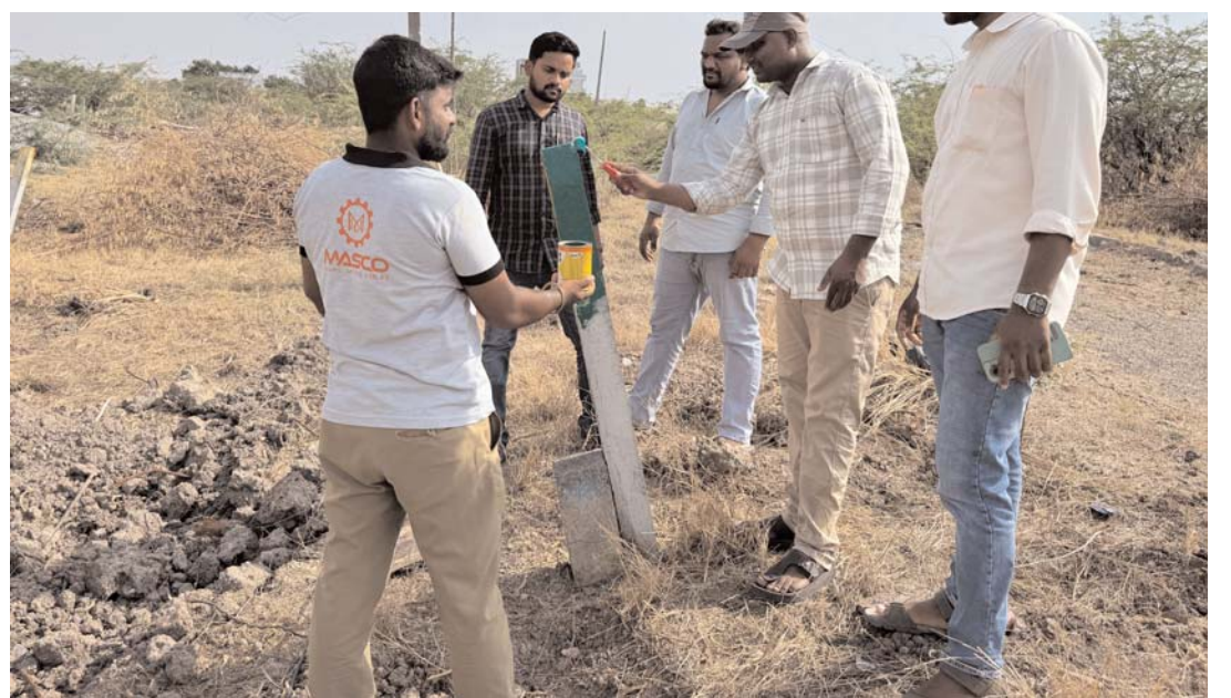
ప్రభుత్వ భూములపై అక్రమ కార్యకలాపాలను నిరోధించడం లక్ష్యంగా చర్యలు చేపట్టబడ్డాయని స్పష్టం చేశారు. మున్సిపాలిటీకి చెందిన ప్రజా అస్తుల రక్షణ ప్రతి పౌరుడి బాధ్యత అని భావించాలని భవిష్యత్తులో ఇటువంటి భూములపై ఎవరైనా అసంకేతికంగా ఆక్రమణలు చేయడం, క్రయవిక్రయాలు నిర్వహించడం లేదా మున్సిపాలిటీ హక్కులకు భంగం కలిగించే చర్యలకు పాల్పడితే చట్టబద్ధ చర్యలు తీసుకోవడం జరుగుతుంది అని తెలి తెలియజేశారు.