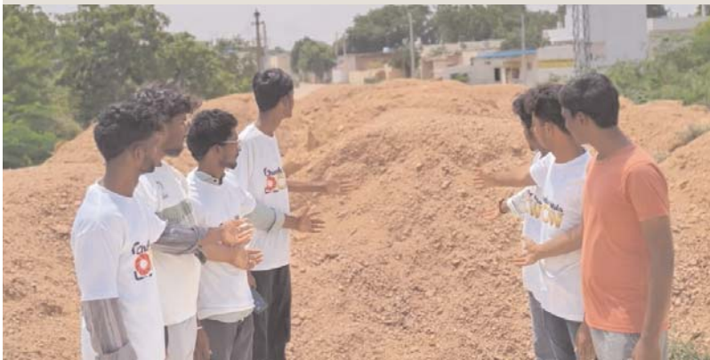
చండూరు జూన్ 15 స్టూన్ వార్

అంగడిపేట బంగారుగడ్డ రోడ్ లో గల ఇండియన్ ఆయిల్ పెట్రోల్ బంక్ వద్ద నిర్మిస్తున్న బ్రడ్డి నిర్మాణం సత్వనడక నడుస్తుందని దానిని త్వరితగతిన పూర్తి చేసి ప్రజా వినియోగంలోకి తీసుకురావాలని చండూర్ వాలా డీం సభ్యులు ప్రభుత్వాన్ని కోరారు.