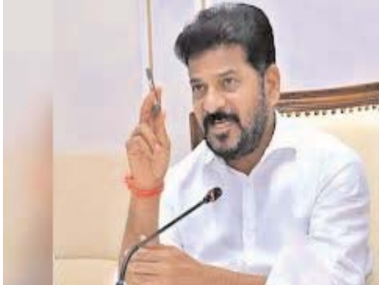
పైలెట్ ప్రాజెక్టును మరింతగా వినియోగించుకోవాలి..

సీఎం రేవంత్ రెడ్డి దిశానిర్దేశం చేశారు. ఏఐఎన్ మరింతగా వినియోగించాలని నిర్దేశించారు. అగ్రికల్చర్ యూనివర్సిటీని నోడల్ ఏజెన్సీగా పెట్టుకొని సాంకేతికతను పెంచుకోవాలని సూచించారు. సీడ్స్ నుంచి కొనుగోలు వరకు వ్యవసాయ శాఖ, సివిల్ సప్లయ్స్, అగ్రికల్చర్ యూనివర్సిటీ సమన్వయంతో పనిచేయాలని సూచించారు. మార్కెట్ నష్టాలను తగ్గించుకునే ప్రయత్నాలు చేయాలని పేర్కొన్నారు. ఆయిల్ ఫెడ్ సబ్సిడీలతో పనిచేయాలని సూచించారు. అన్ని వ్యవసాయ చేపందలకు సంబంధించి ఓ యాప్ ఏర్పాటు చేసుకోవాలని సూచించారు. యాప్ ద్వారా బుక్ చేసుకునే యూనియన్లను రైతు వేదిక ద్వారా పంపిణీ చేయాలని అన్నారు. జిల్లా ఆదన కలెక్టర్లకు యూనియన్ల పంపిణీ బాధ్యతను అప్పగించాలని ఆదేశించారు. యూనియన్, ఇతర ఎరువుల కేటాయింపులపై ఎప్పటికప్పుడూ కేంద్రప్రభుత్వానికి లేఖలు రాయాలని ఆదేశించారు.