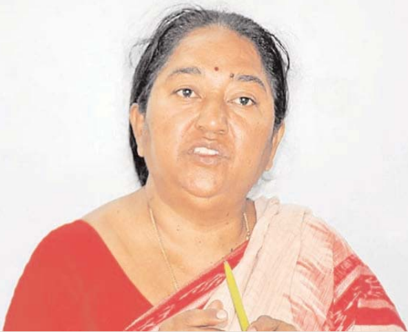
చాటుపుల జూన్ 18 (సూస్ వార్)

కేంద్ర ప్రభుత్వం రైతులకు ఇచ్చే సబ్సిడీలకు కోతవెంది ఎరువుల ధరలను విపరీతంగా పెంచినందుకు రైతు సంఘం రాష్ట్ర ప్రధాన కార్యదర్శి పశ్చిమ విమర్శించారు. రైతు వ్యతిరేక విధానాలను కొనసాగిస్తున్న కేంద్ర పాలకులకు వ్యతిరేకంగా రైతులు సమీక్షలు చేపట్టాలని ఎరువుల ధరలు తగ్గించే వరకు ఘోషించాలని పిలుపునిచ్చారు. కాంపెక్స్ ఎరువుల ధరలు పెరగడంతో రైతులు వాటిని కొనుగోలు చేసే పరిస్థితి లేకుండా పోయిందని ఆవేదన వ్యక్తం చేశారు. వర్షాలు లేక నాటిన పత్తి విత్తనం మొలకెత్తుతూ లేదా అని రైతులు దిగులు పడుతున్నారని తెలిపారు. వ్యవసాయ అధికారులు ఎక్కడిక్కడ గ్రామ స్థాయిలో ఎల్ నితో ప్రమాదాన్ని రైతులకు విస్తృతంగా ప్రచారం చేయడం ద్వారా చైతన్యపంథం చేయాలని కోరారు.