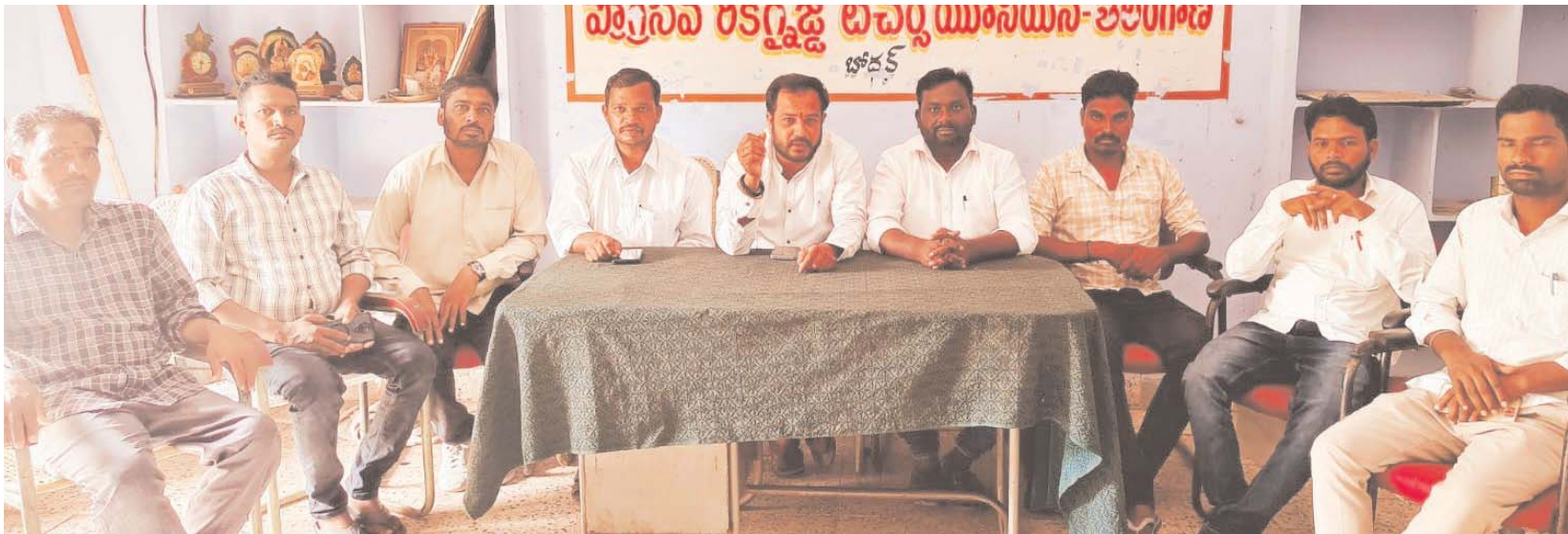
బోధన్ జూన్ 26 (స్వామి వార్ )

పట్టణంలోని పలు ప్రైవేట్ పాఠశాలల్లో పాఠ్యపుస్తకాల అమ్మకాలు నిర్వహిస్తున్న వారిపై విద్యాశాఖ అధికారులు చర్యలు తీసుకోవడం లేదని విద్యార్థుల తల్లిదండ్రుల నుండి బలవంతంగా బుక్స్ పేరుతో అడ్డవిస్తూ పేరుతో ఫీజులు వసూలు చేస్తున్న ప్రైవేట్ స్కూల్స్ యాజమాన్యం పై చర్యలు తీసుకోవాలని బోధన్ లో కొన్ని పాఠశాలలో సరైన సౌకర్యాలు లేకున్నా ఎం.కే.ఎ. కనీసం అటువైపు చూడకుండా నిమ్మకు నీరుతున్నట్టుగా వ్యవహరిస్తున్నారని అన్నారు. ప్రైవేట్ పాఠశాల పేరుతో నోట్ బుక్స్ మరియు అడ్డవిస్తూ పేరుతో సౌకర్యాలు లేకుండా పాఠశాలను నడిపిస్తున్న