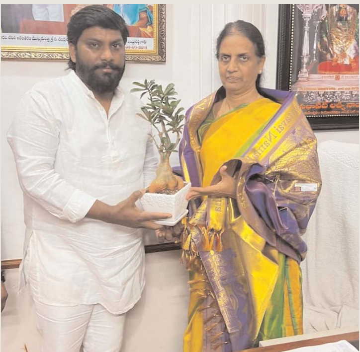
ఇల్రహింపట్లం జూలై 6