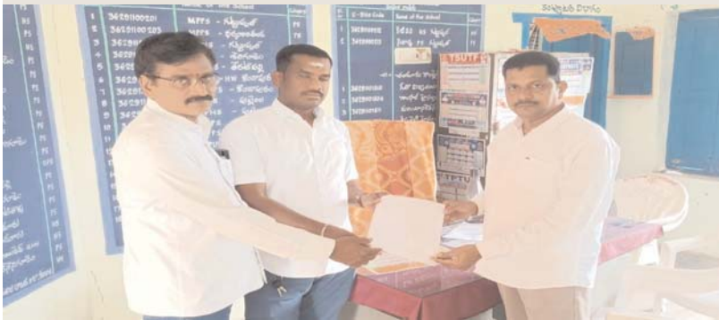
చందూరు జూలై 6 (స్వామి వార్)