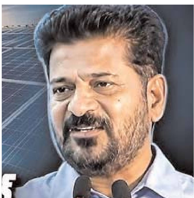
తెలంగాణ నుంచే ముఖ్యమంత్రి రేవంత్ రెడ్డి రంగారెడ్డి, న్యూస్ వార్ ప్రతినది

ప్రపంచంలో బెస్ట్ లివింగ్ సిటీగా హైదరాబాద్ భాగ్యనగరాన్ని కూడా కాలుష్య సమస్య వేధిస్తోంది మూసీని ప్రక్షాళన చేయాలని నిర్ణయించాం కోర్ అర్బన్ ఏరియాను అభివృద్ధి చేయడానికి ప్రత్యేక పాలీసీ పరిశ్రమలను ఔటర్ అవతలకు తరలించబోతున్నాం ఓఆర్ఆర్ అవతల పరిశ్రమలకు భూములు దేశ జీడిపీలో 10 శాతం వాటా